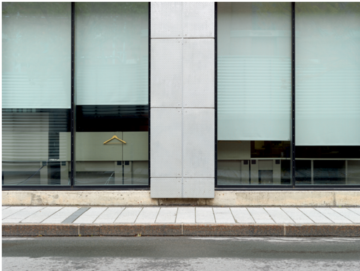
Horizon #052 (Havana), 2017, 110 × 147 cm True Nature #031 (Montreal), 2018, 20 × 27 cm