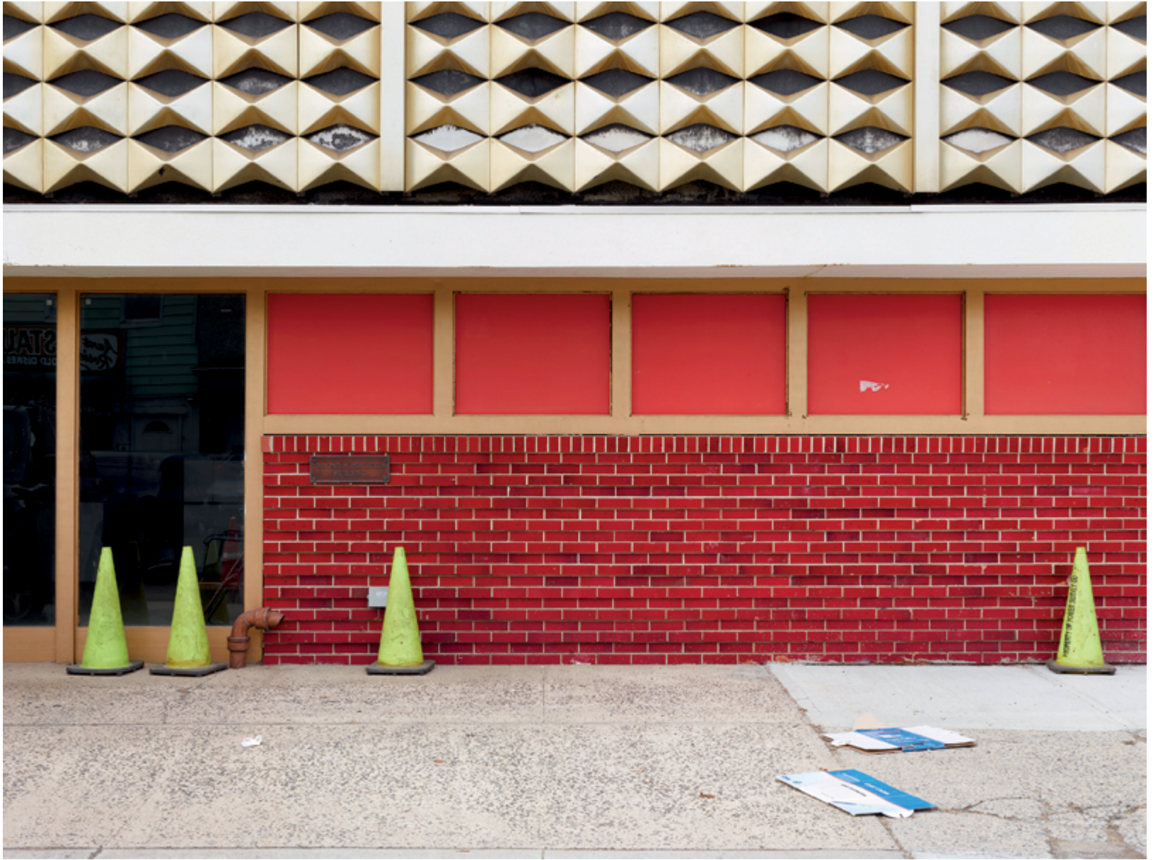
True Nature #003 (Hanoi), 2016, 20 × 27 cm True Nature #020 (New York), 2017, 20 × 27 cm

TOUTES LES PHOTOS / ALL PHOTOS Archival pigment prints on fine art paper / épreuves pigments d'archives sur papier fine art