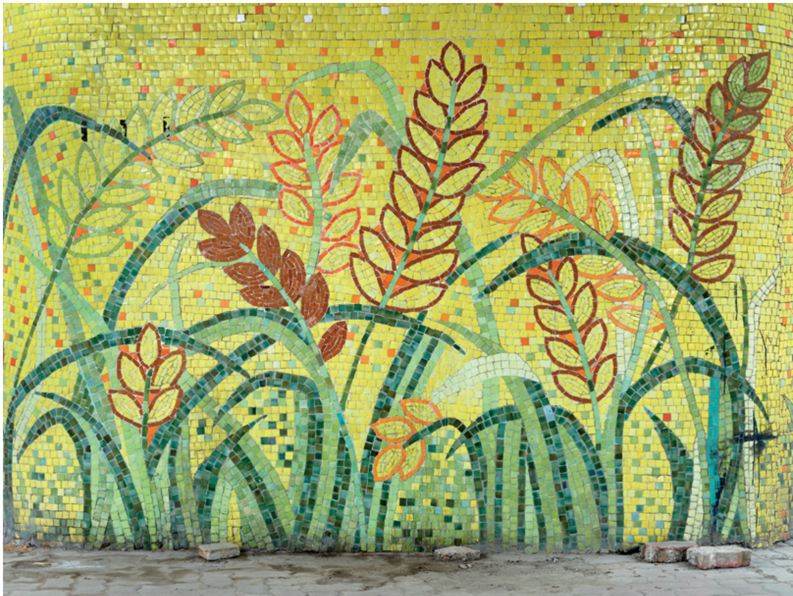
Horizon #01 (Hanoi), 2016, 110 × 147 cm