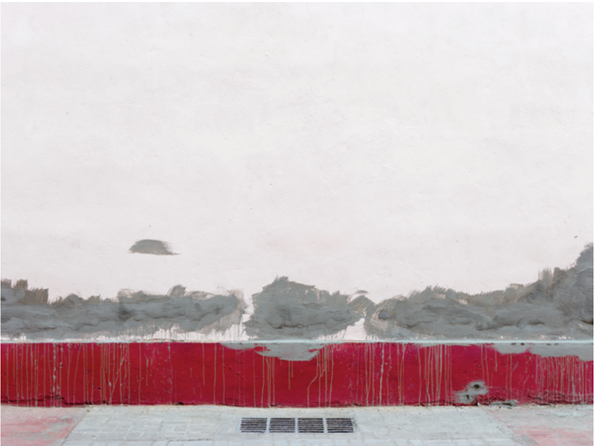
Horizon #047 (Havana), 2017, 110 × 147 cm True Nature #063 (Santiago), 2017, 110 × 147 cm