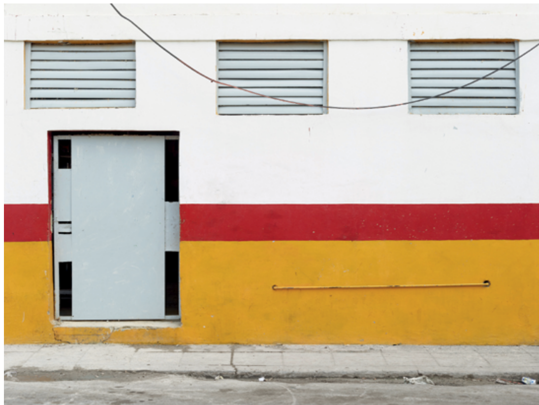
True Nature #054-069 (Havana), 2017 60 x 80 cm ea./ch.